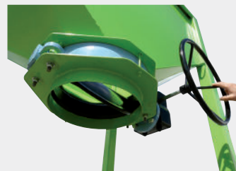
Válvula de mariposa con volante