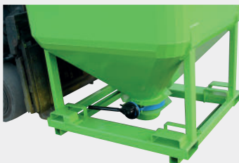
Válvula de mariposa con palanca