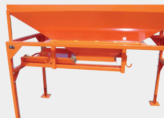
Trampilla corrediza de rodillos exteriores