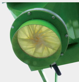
Válvula de diafragma