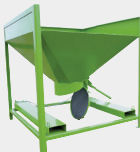
Salida redonda, estanca con palanca excéntrica