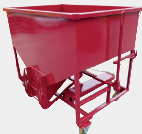
Trampilla guillotina estanca

Vaciado controlado y canalizado. Diferentes salidas.