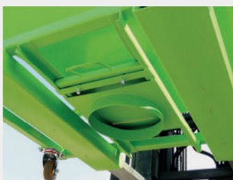
Trampilla corrediza simple para productos ligeros