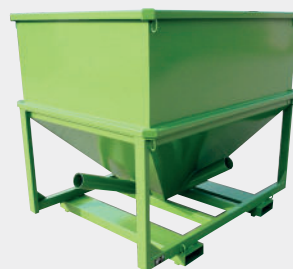
Tolva para bastones de aspiración