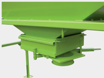
Trampilla pivotante articulada