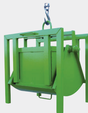
Tolva con casco toma grúa