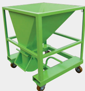
Trampilla con casco sin puerta