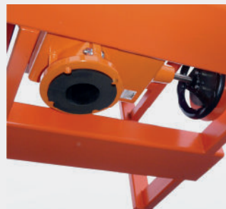
Válvula de cierre