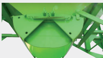
Trampilla doble casco