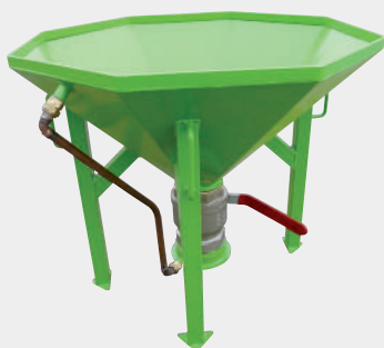
Válvula de bola