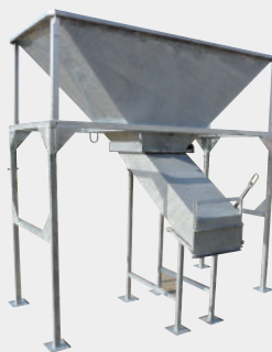
Trampilla guillotina y salida especial