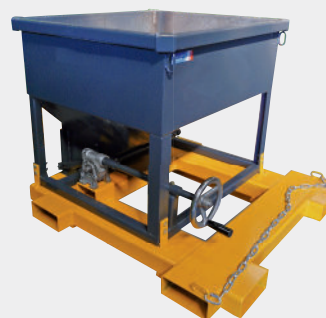
Guillotina de regulación de flujos por reductor de ángulo