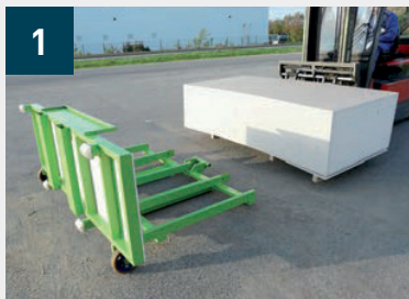
1 Cargar placas en la carretilla