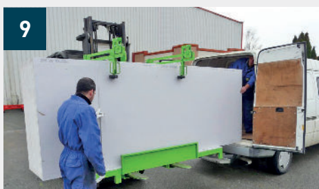
9 Cargamento facilitado simplemente deslizando las placas hacia la derecha Después de distribuirlas, recolocar el brazo de ajuste para mantener las placas restantes