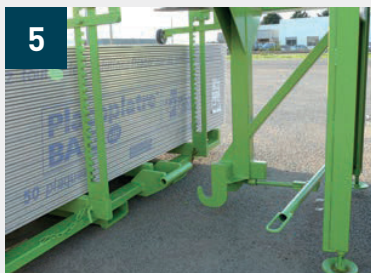
5 Agarre de la carretilla MP con el pescante - Palanca con clip para bloquear automáticamente el gancho en la carretilla MP sin intervención del operador de la carretilla