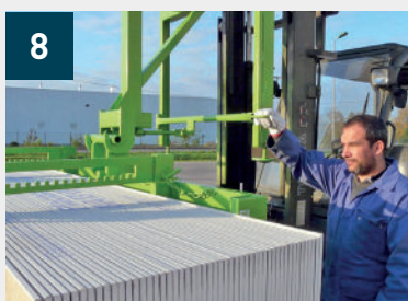
8 Cierre en clip de la palanca que permite desenganchar y retirar el pescante PK