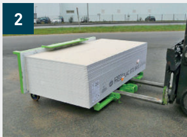
2 Depositar paquetes