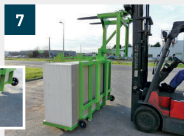
7 Carretilla en posición de descarga antes de retirar el pescante PK