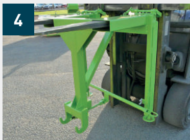
4 Enganche del pescante PK en la carretilla elevadora