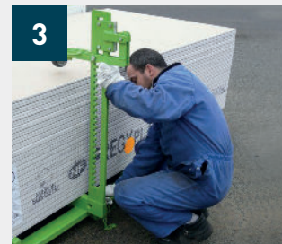
3 Posición de los brazos de retención regulable