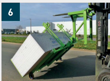
6 Volteo de la carretilla en vertical, 4 patines PEHD que evitan dejar marca en el suelo