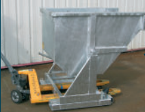
Toma transpalet entre los acoplamientos