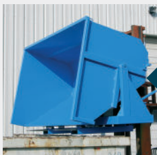
Toma en el tope de horquillas