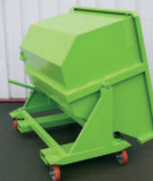
Refuerzos de caja