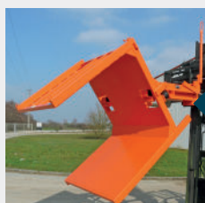
Versión especial con caja de chapa