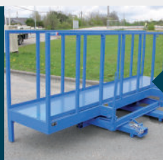
Especial para gran longitud