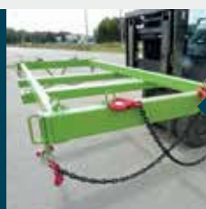
4 soportes para fijación de los ganchos después la utilización