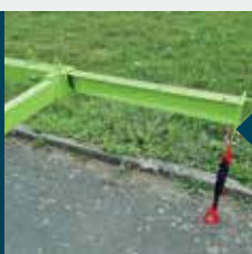
Cadena de elevación con gancho de seguridad y anillo acortador